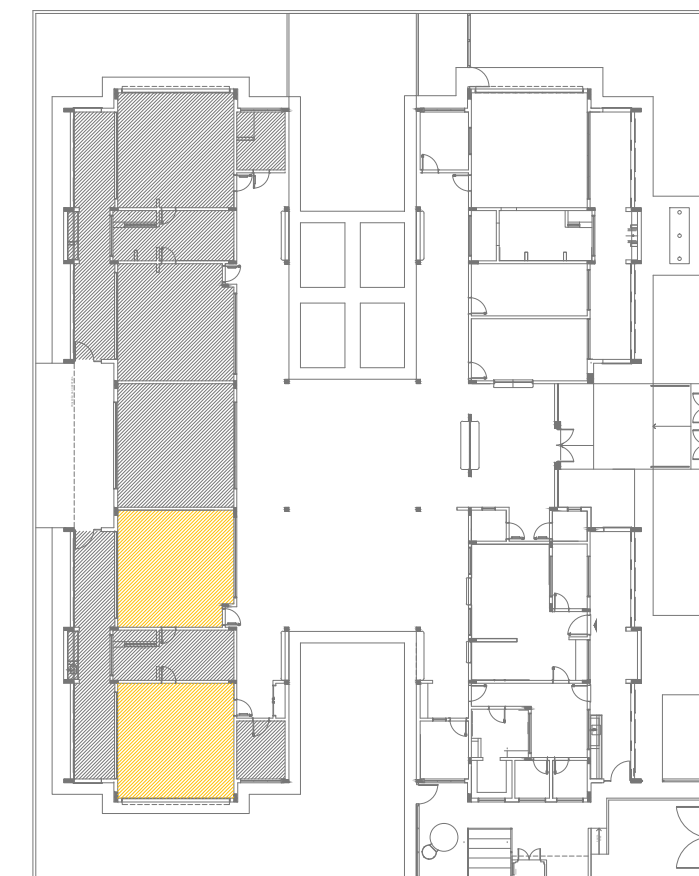
CROQUI DE REFERÊNCIA